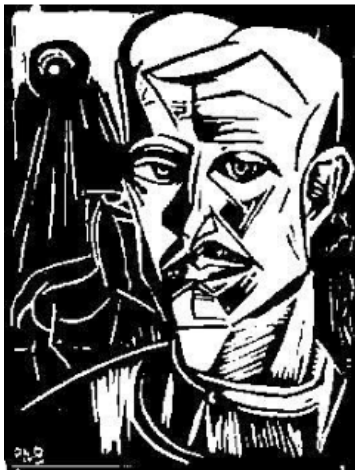
Image transmise par le « fax atomique » © image originale : Fondation P.A. Bockstiegel

Ce travail est publié dans la revue Physical Review Letters .