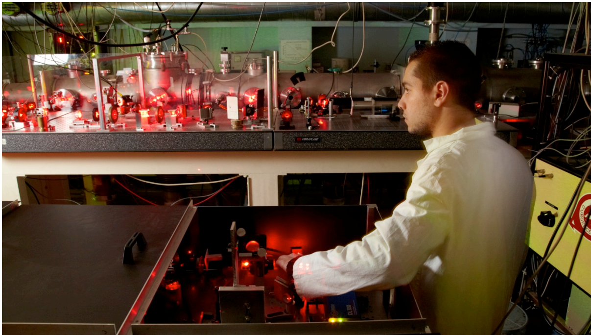
fig. 2 : interféromètre à atomes du LCAR